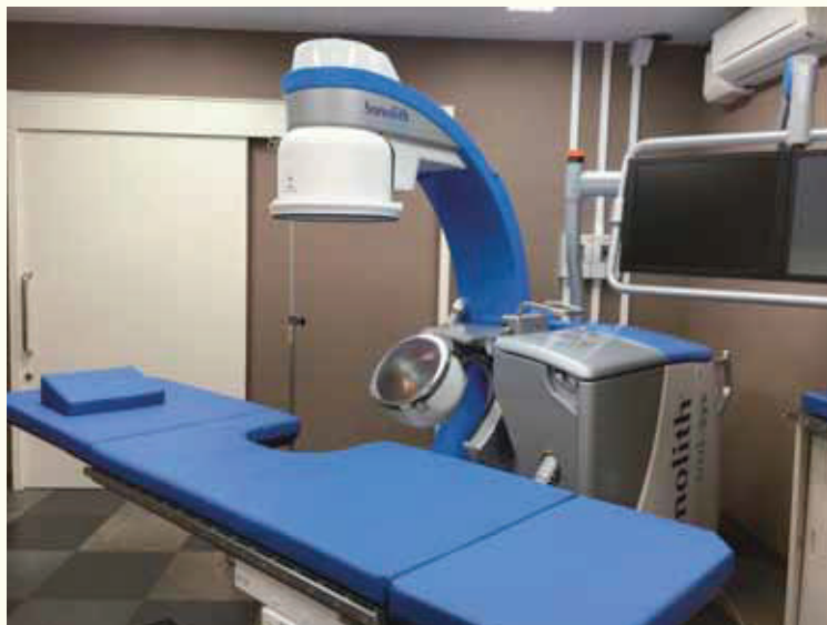
体外衝撃波結石破碎療法（ESWL）

尿路結石の治療ですが、当院では今年の5月1日から体外衝撃波結石破碎療法（ESWL）という手術を始めました。